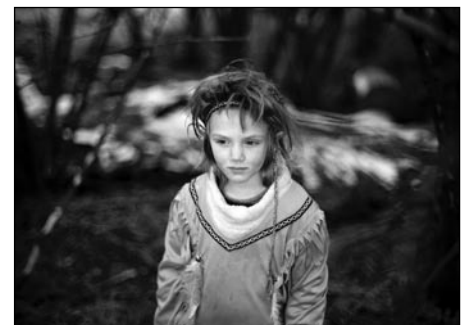
© Birgit Krause, »one little indian«